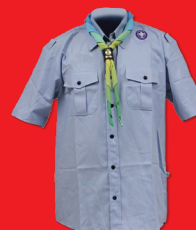
Uniforme Escoteiro - Modalidade do Ar