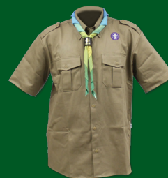
Uniforme Escoteiro - Modalidade Básica

ESSE MAPA DE LOCALIZAÇÃO DOS DISTINTIVOS TAMBÉM É VÁLIDO PARA: