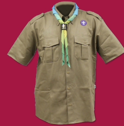
Uniforme Escoteiro - Modalidade Básica

ESSE MAPA DE LOCALIZAÇÃO DOS DISTINTIVOS TAMBÉM É VÁLIDO PARA: