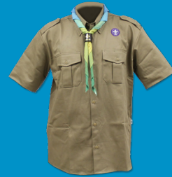
Uniforme Escoteiro - Modalidade Básica

ESSE MAPA DE LOCALIZAÇÃO DOS DISTINTIVOS TAMBÉM É VÁLIDO PARA: