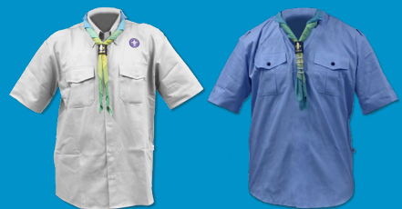
Uniforme Escoteiro - Modalidade do Mar (Embarque e Desembarque)