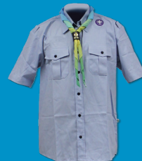
Uniforme Escoteiro - Modalidade do Ar