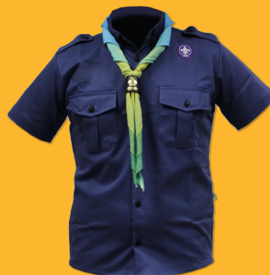
Uniforme para Lobinhos e Lobinhas

ESSE MAPA DE LOCALIZAÇÃO DOS DISTINTIVOS TAMBÉM É VÁLIDO PARA: