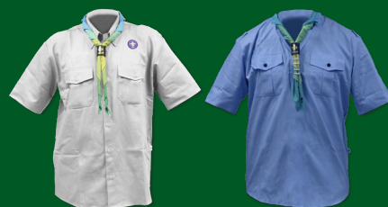
Uniforme Escoteiro - Modalidade do Mar (Embarque e Desembarque)