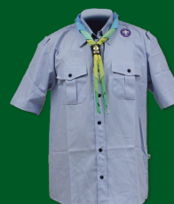
Uniforme Escoteiro - Modalidade do Ar