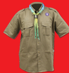
Uniforme Escoteiro - Modalidade Básica

ESSE MAPA DE LOCALIZAÇÃO DOS DISTINTIVOS TAMBÉM É VÁLIDO PARA: