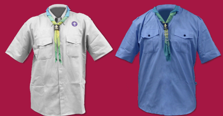
Uniforme Escoteiro - Modalidade do Mar (Embarque e Desembarque)