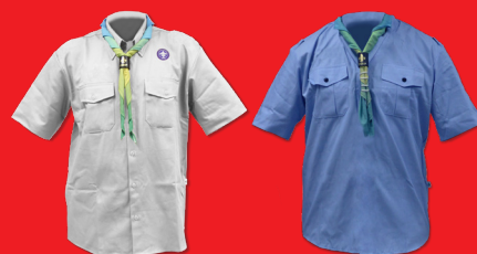
Uniforme Escoteiro - Modalidade do Mar (Embarque e Desembarque)