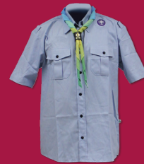
Uniforme Escoteiro - Modalidade do Ar