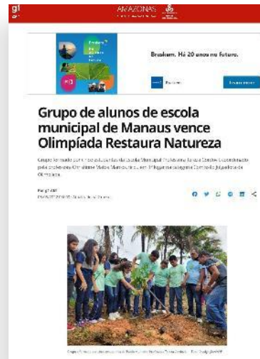
Portal G1 Amazonas