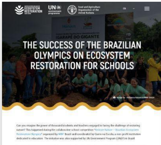
Site da ONU