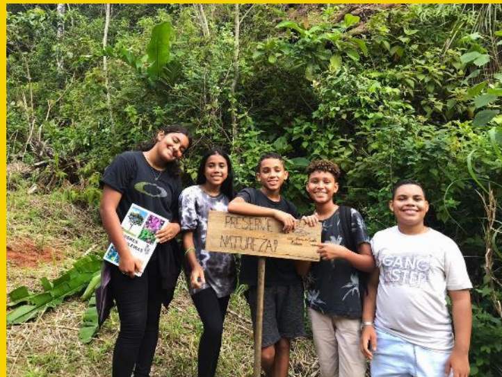
Alunos da Escola Municipal Prof.ª Edileusa Brasil Soares de Souza, de Maresias - SP, criaram os grupos The Five e Nature is Life, ganhadores da Restaura Natureza 2022

O grupo deve enviar um registro relatando a ação até 30 de Junho.