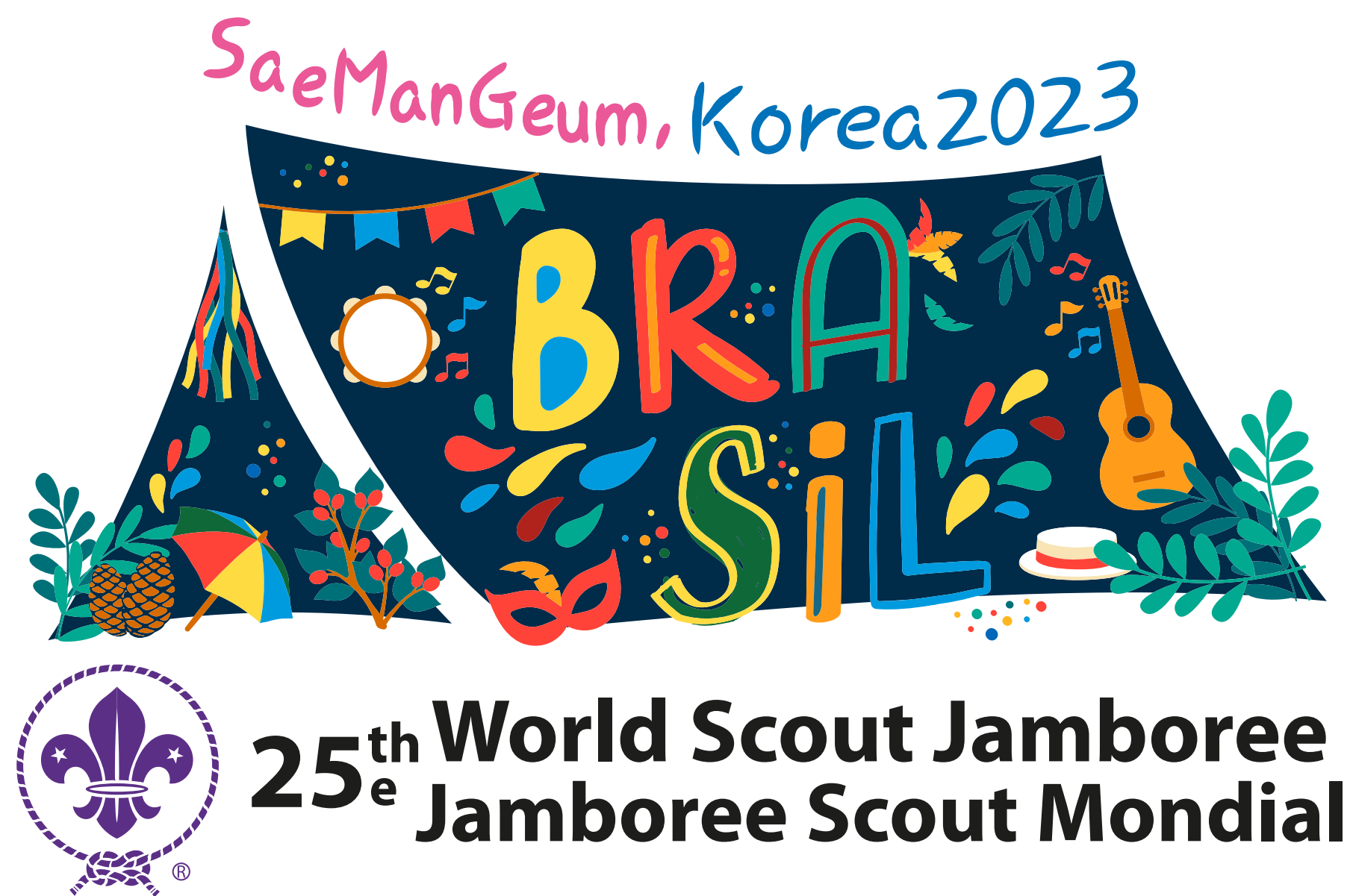
Aplicação sob fundo branco