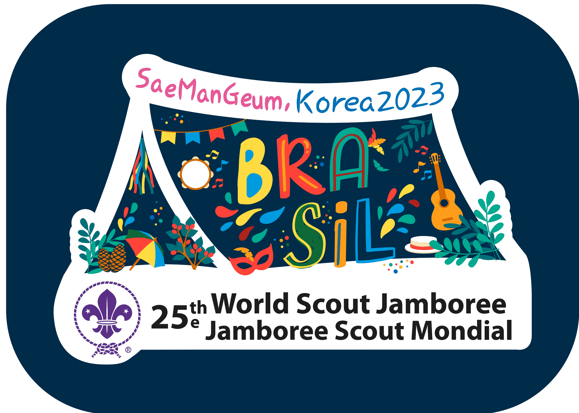
Aplicação sob fundo colorido