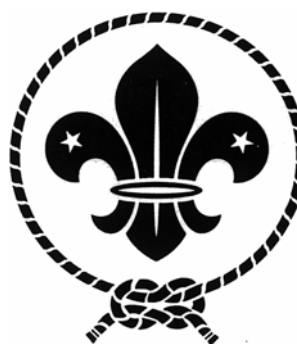
SÍMBOLO DA ORGANIZAÇÃO MUNDIAL DO MOVIMENTO ESCOTEIRO