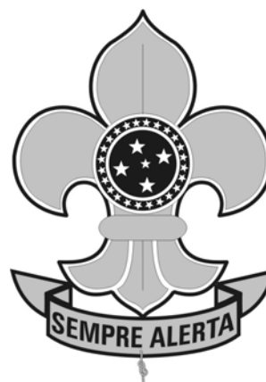
FLOR DE LIS SÍMBOLO DA UEB

A União dos Escoteiros do Brasil, "UEB", fundada em 4 de novembro de 1924, é uma sociedade civil de âmbito nacional, de direito privado e sem fins lucrativos, de caráter educacional, cultural, beneficente e filantrópico, reconhecida de utilidade pública, que congrega todos quantos pratiquem o Escotismo no Brasil. (Estatuto da UEB - Art. 1º)