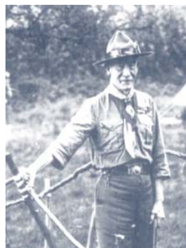
ROBERT BADEN-POWELL FUNDADOR DO ESCOTISMO

A história completa do Fundador do Movimento Escoteiro é encontrada em vasta literatura a venda nas Lojas Escoteiras