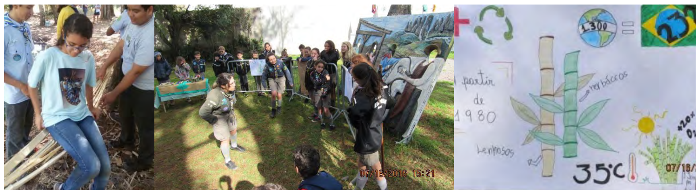
FIGURAS 5 e 6 – Oficinas de bambu realizadas pelo 10º./RO e pelo 296º./RS no 25º MutEco

Para outros cuidados ao acampar, consulte o Guia da IMMA.