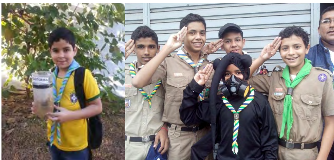
FIGURAS 13 e 14 – Combate à dengue feito pelo 6º./AC e pelo 11º./CE no 25º MutEco