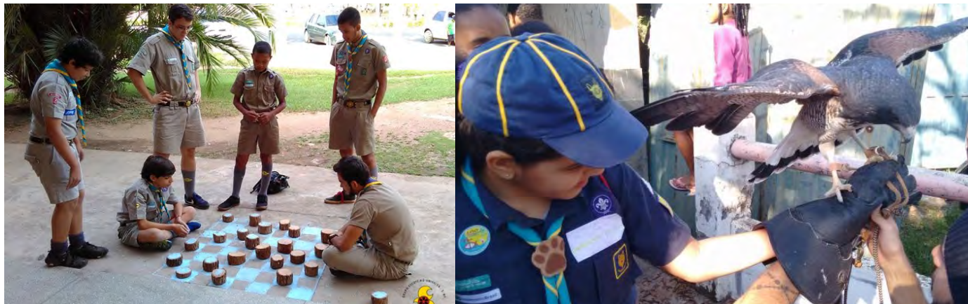
FIGURAS 11 e 12 – Atividades de educação ambiental dos GEs 2º./MT e 188º./MG