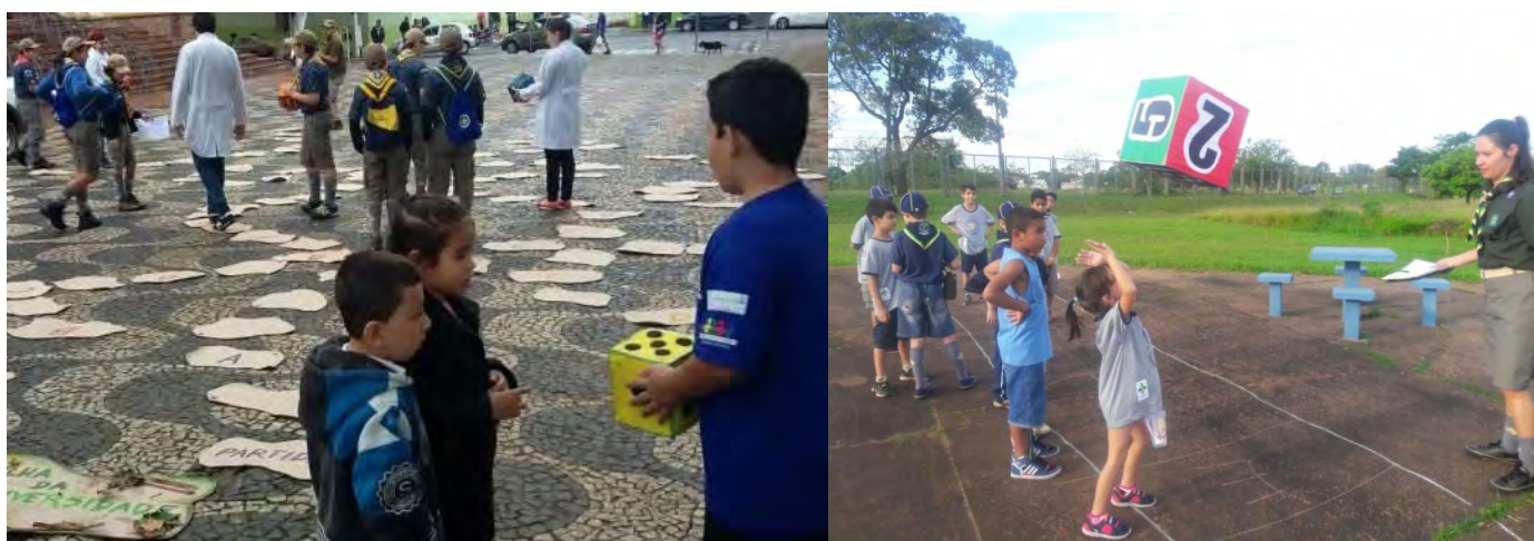
FIGURAS 7 e 8 – Trilha da biodiversidade feita pelo 30º./MS e pelo 402º./SP no 25º MutEco

Esse jogo também pode ser realizado catando-se o lixo de uma determinada área.