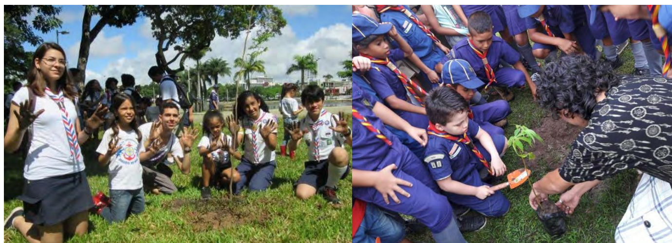
FIGURAS 1 e 2 – Plantio de mudas promovido pelo 16º./PB e pelo 48º./PA no 25º MutEco

Reduza o descarte: Outra dica importante é utilizar integralmente os alimentos. Ainda é comum o descarte de cascas e folhas, que poderiam render receitas tão saborosas e nutritivas quanto aquelas que utilizam a parte convencional dos alimentos.