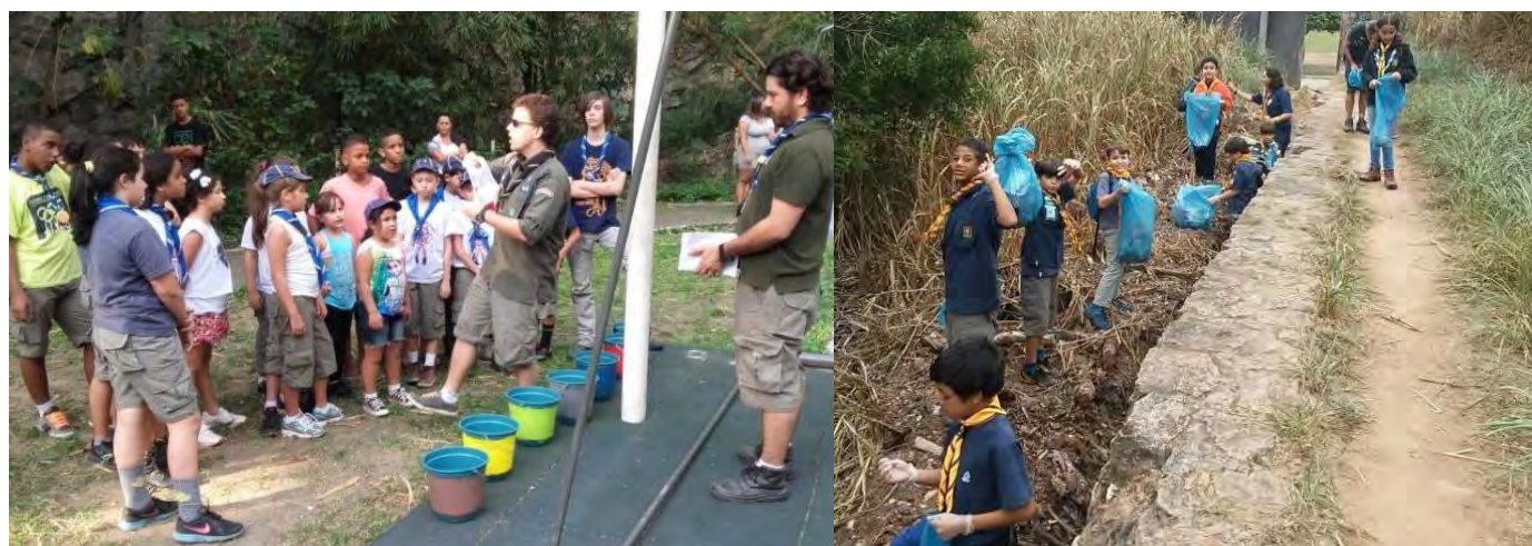
FIGURAS 9 e 10 – Atividades sobre reciclagem dos GEs 81º./RJ e 16º./ES no 25º MutEco

Em uma manhã de primavera, uma menina, chamada Ana, e sua mãe estavam passeando pela cidade em que moravam e notaram que em frente a diversos locais de moradia havia lixo jogado no chão, fora das sacolas plásticas ou dos sacos de lixo. Elas não entenderam como isso poderia estar ocorrendo, então decidiram sentar debaixo de uma árvore e observar porque aquilo acontecia. Nos próximos minutos, notaram que chegavam algumas crianças que retiravam do lixo apenas latas de alumínio e embalagens longa vida. O restante era jogado de qualquer forma nas calçadas, que além de poluir, entupia os bueiros, contribuindo para causar os alagamentos da cidade em épocas de chuvas. Bastante preocupadas, Ana e sua mãe foram até um lugar onde estava reunido o Grupo Escoteiro ou a Seção Autônoma, e expuseram o problema para os jovens. Então, o que os participantes poderiam fazer para ajudar a solucionar o problema? E como vocês, pessoas preocupadas com a natureza, ajudariam a solucionar esse caso?