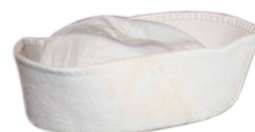
Caxangá, "bico-de-pato" ou quepe (com distintivo da modalidade)