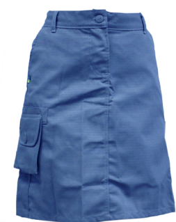
Bermuda, calça ou saia (azul mescla)