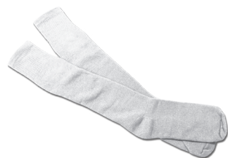
Branca, preta ou cinza (obrigatório)