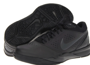
Branco ou preto