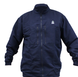
Conforme definido na regra 047-II-B