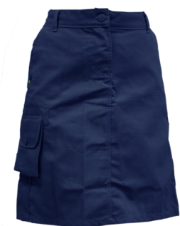
Bermuda, calça ou saia (azul marinho)