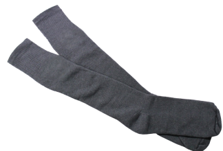
Branco, preto ou cinza (obrigatório)