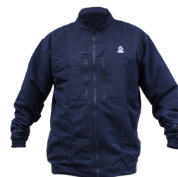
Conforme definido na regra 047-II-B